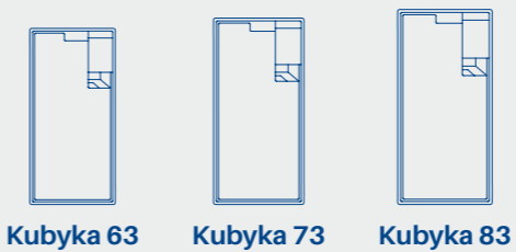
Kubyka 63 Kubyka 73 Kubyka 83